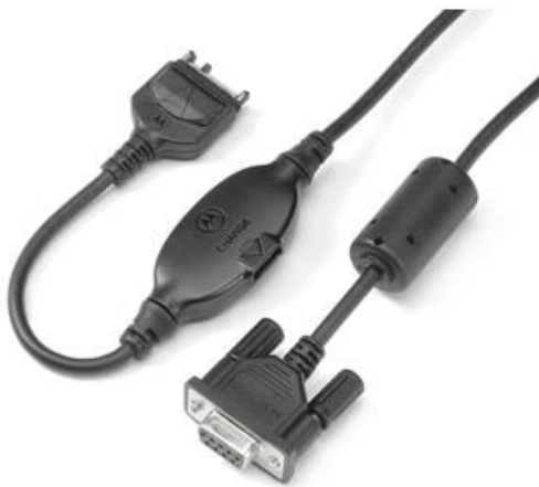
Abbildung: Motorola PMKN4025A (links), KAB-MOT-WT676 (rechts)